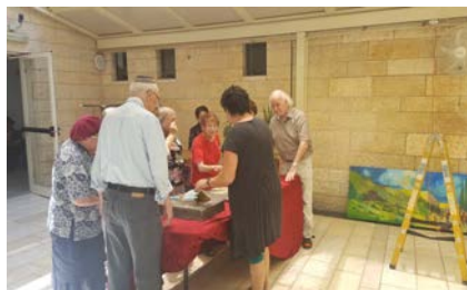
De bewoners vroegen ons om iets over het tot stand komen van het werk te vertellen